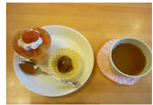
達成したトマトのおやつ