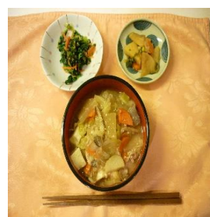
☆さつま芋バージョン達成！