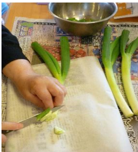
☆手際よく野菜を切ってます