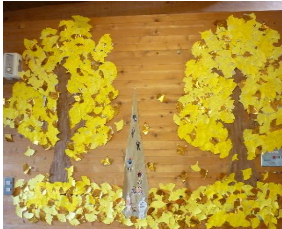
大きなイチョウ並木