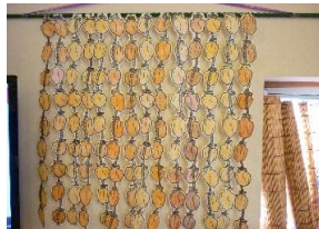
干し柿ぬり絵のカーテン