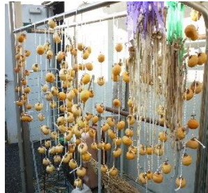
☆干し柿のカーテン