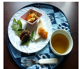
☆紐から外しおやつへ