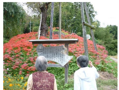
☆根木屋の彼岸花を観に行きました。2回目は見頃でした。秋桜も綺麗です。